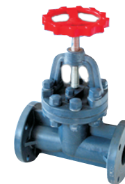
J41V-150 [P] F (FRPP)

在线销售QQ: 1695332978 1048295796 2184211527 1397252472