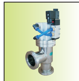
QZKDJ-50BF s Ib02 (ISO卡钳法兰连接)