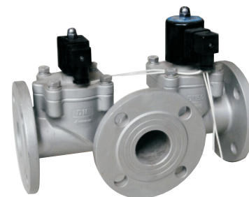
Z (291+292) 31-65BFIb24 (普通换向型)