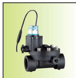
Z199-15 \bar{A} Ib16-mC (DN15~25, IP67) (防雨淋带手动磁保持)