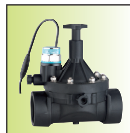
Z199-40 \bar{A} Ib16-mC (DN32~50, IP67) (防雨淋带手动磁保持)