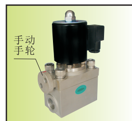
Z271-15BIb24-160& (带手动装置) 手动复位后才能 通电实现正常工作