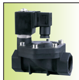
Z191-32 \bar{A} 1b02