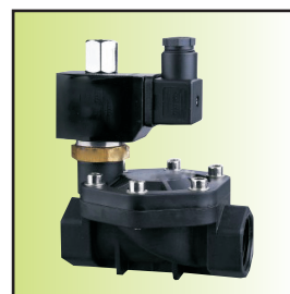
Z192-25 \bar{A} 1b02