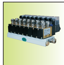
Z1753-04 i 02-8F (8只组件，双作用控制)