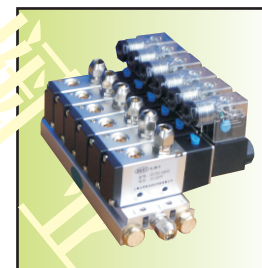
Z1753-04 i 02-6F (6只组件，单作用控制)