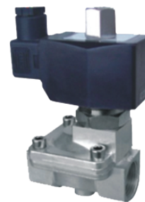
Z112-15R II e02